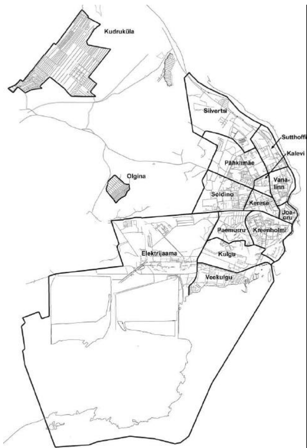
Joonis 1. Narva linnaosade skeem